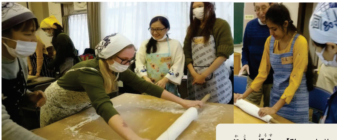
過去の様子 【The past situation】

定員【Capacity】: 日本人10人、外国人10人(多数抽選)【10 Japanese people, 10 foreigners】